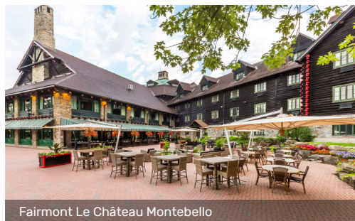
Fairmont Le Château Montebello