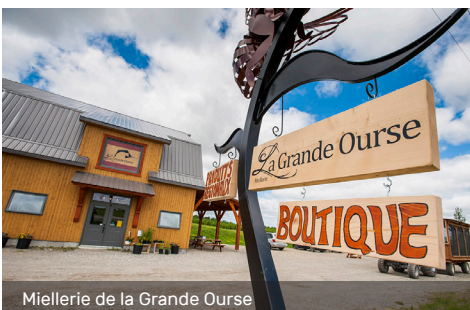
Miellerie de la Grande Ourse