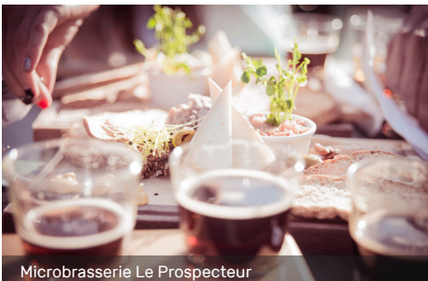
Microbrasserie Le Prospecteur

Emboitez le pas aux explorateurs d'hier et d'aujourd'hui pour partir à la découverte de l'histoire du Québec et du Canada. Parcourez les musées, les sites historiques et patrimoniaux pour saisir l'histoire étonnante des Premières Nations et des Canadiens-Français. La culture autochtone, le commerce des fourrures, la drave, le chemin de fer, une ancienne mine d'or, des cabanes à sucre sont autant d'attraits qui vous feront comprendre ces régions qui possèdent une culture riche et authentique, excentrique et singulière.