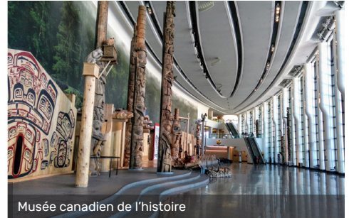
Musée canadien de l'histoire