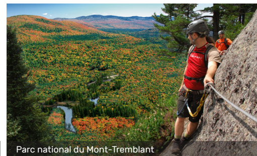
Parc national du Mont-Tremblant