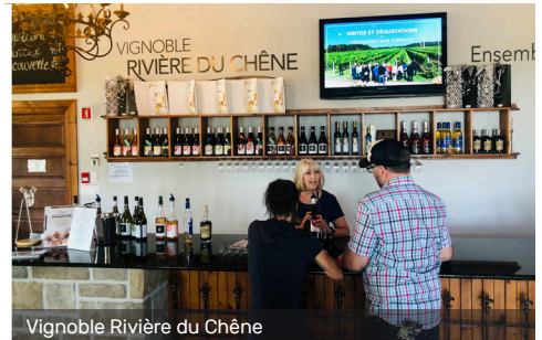
Vignoble Rivière du Chêne