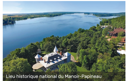
Lieu historique national du Manoir-Papineau