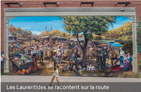
Les Laurentides se racontent sur la route