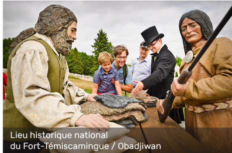
Lieu historique national du Fort-Témiscamingue / Obadjiwan