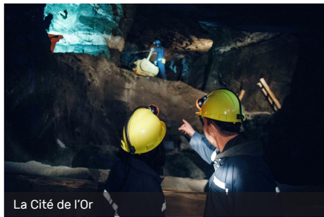
La Cité de l'Or