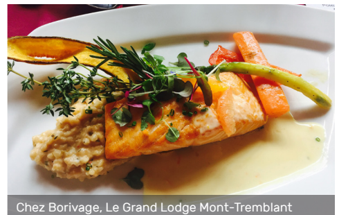
Chez Borivage, Le Grand Lodge Mont-Tremblant