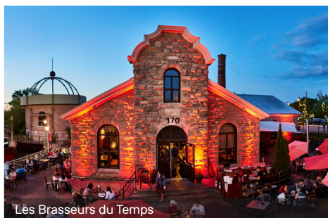
Les Brasseurs du Temps